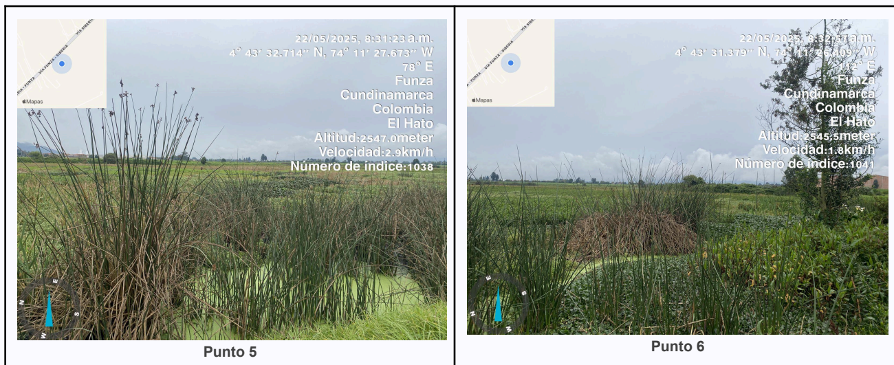
Ilustración 2. Fotos de los puntos del Recorrido de Control Y Vigilancia Ronda Del Humedal Gualí.

C.P 250020 Tel. (601) 8234070 823 40 71 / 823 40 73 Fax. (601) 8257620 Dir. Cra. 14 No. 13-05 03-FR-17 VER.10.2024